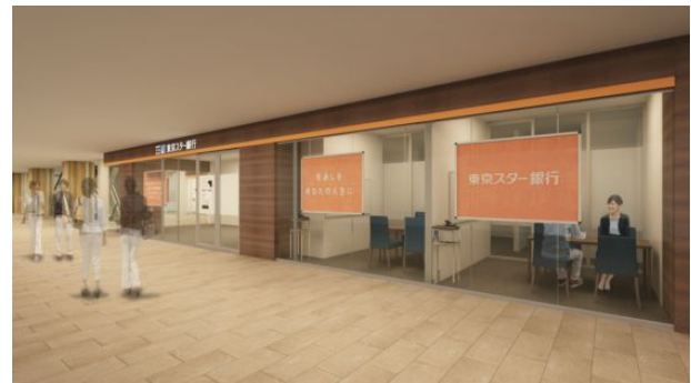
難波支店ファイナンシャル・ラウンジイメージ

当行では、お客さまの将来の資産形成、定年退職時までの貯蓄、老後資金計画などのために、さまざまなライフプランツールでお客さまの人生に見通しをたてる「お金の未来診断」に注力しております。各世代のお金に関する悩みや不安に対して、お客さまと一緒に向き合い、不安を解決するためのお手伝いをさせていただきます。