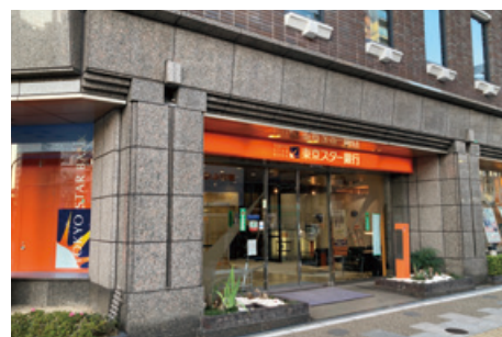
上野支店ファイナンシャル・ラウンジ